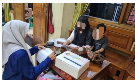
Gambar 3 Wawancara

Mendistribusikan modul DONBO seperti Gambar 3, menyediakan pelatihan, dan memonitor efektivitasnya.