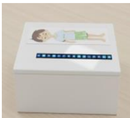
Gambar 2 Modul DONBO

Membuat prototipe dan melakukan pengujian awal pada 6 anak dengan rentang usia 5 hingga 6 tahun seperti pada Gambar 2.